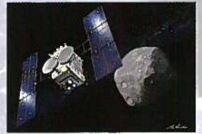
イラスト: 池下章裕