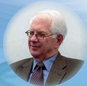
シェルドン・グラショウ博士 Sheldon Lee Glashow